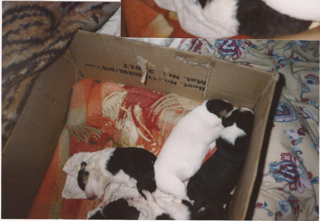
und wieder Schlafen...