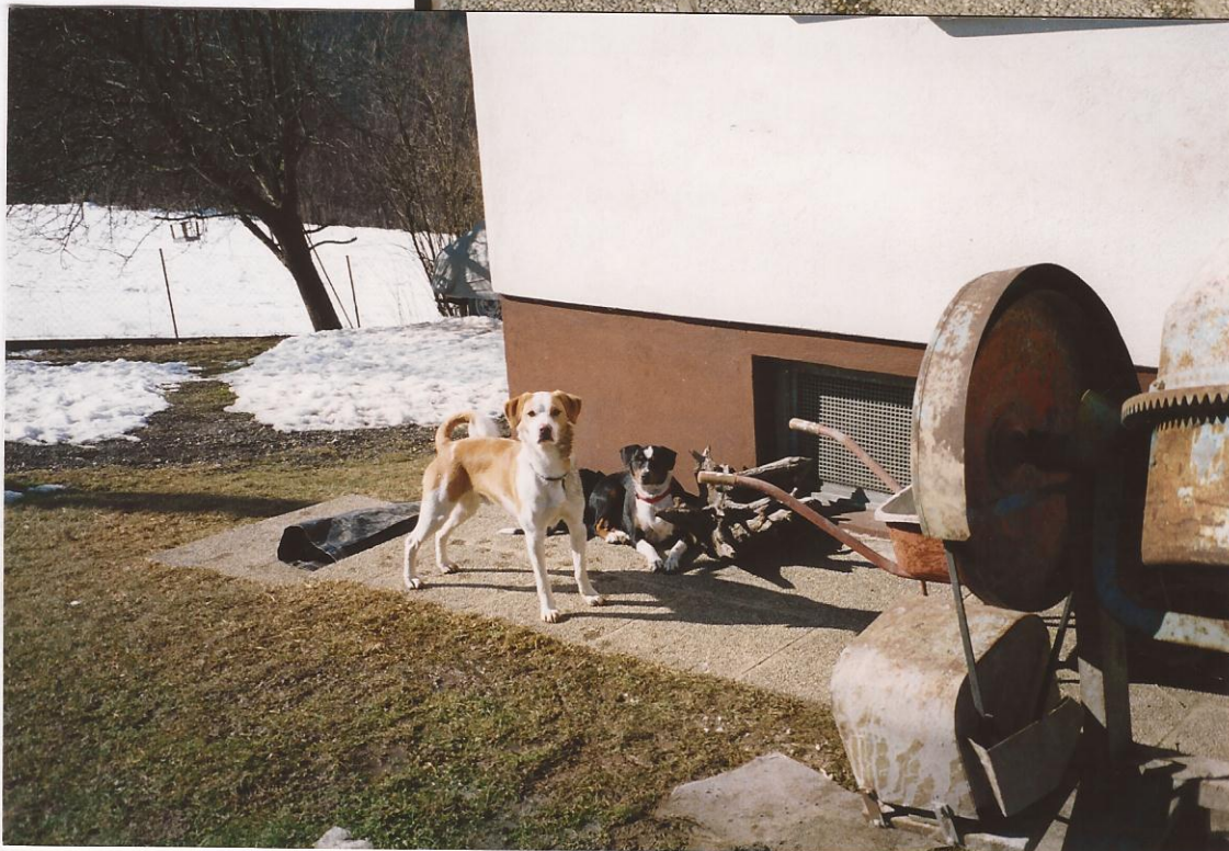
Was, wo, wer??